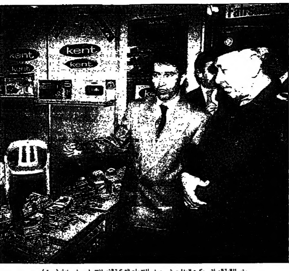
وزير المالية العراقي حكمت المرادي، في معرض المنتجات التركية التي افتتح اسم في بغداد

غير ان محللين قالوا انه لا يمكن لتركيا الحصول على غاز طبيعي من العراق حتى توقع الامم المتحدة المعقوبات التي ترفضها عليه وهو امر غير متوقع في وقت قريب على الرغم من مراجعات الامم المتحدة الدورية للمعقوبات. وسمحت الامم المتحدة للعراق في العام الماضي ببيع ما قيمته مليارات دولار من النفط في ستة اشهر لتسهيل شراء الغذاء والدواء، ويتيح هذا الاتفاق في يونيو ولكنه قابل للتجديد لعدة اشهر اخرى. وفي اطار محاولاته لتقليل اعتمادها على الفحم والنفط وتكوين مصادر الغاز الطبيعي ابرمت تركيا عدة صفقات مع موردين بعد اتفاق فانكاف مقابل الغذاء. وافق العراق في 22 كانون الثاني من هذا العام على صفقة مع روسيا وشركائها في الغاز. وتشترى تركيا حاليا الغاز من روسيا والجزائر، وتشمل صفقاتها في الفترة الاخيرة اتفاقات على شراء الغاز من ايران ومن روسيا ومن تركمنستان وايران ونيجيريا واليمن وقطر. وتستخدم تركيا نحو تسعة مليارات متر مكعب من الغاز الطبيعي سنويا منها ستة مليارات تأتي من تركيا. ويعمل على تطوير حقول الغاز في العراق مع شركة تركية متخصصة في تطوير حقول الغاز في العراق. وقد قامت عدة وفود اقتصادية لتأمين مصافي السفن التركية التي اصبحت ممتلئة بعد اتفاق فانكاف مقابل الغذاء. وافق العراق في 22 كانون الثاني من هذا العام على صفقة مع روسيا وشركائها في الغاز. ويضم العرض التجاري الذي افتتحه وزير المالية العراقي حكمت مرادي في ايامه منتجات غذائية ولايات زراعية وحدود طبية. ولم يقل ابراهيم ما اذا كان العراق سيخترق اي شيء من الشركات العارضة، ولكنه قال ان الروابط التجارية بين البلدين متنامية وان هناك اتفاقا جديدة لتعاون اكبر.